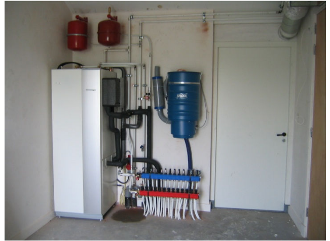
De warmtepomp is tegen de achterwand van de garage geplaatst naast het centrale stofzuigersysteem.