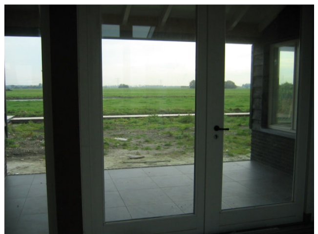
Geen radiatoren voor de ramen