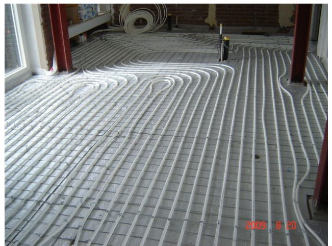
Vloerverwarming voor verwarmen en koelen