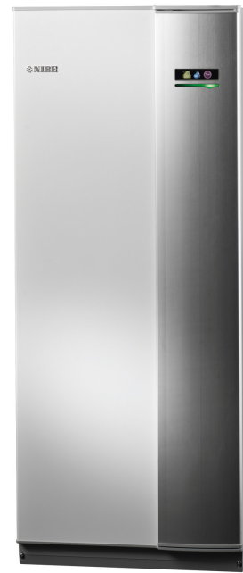
Moderne zeer stille warmtepomp