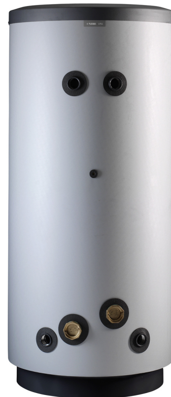
Grote boiler voor veel warm tapwater